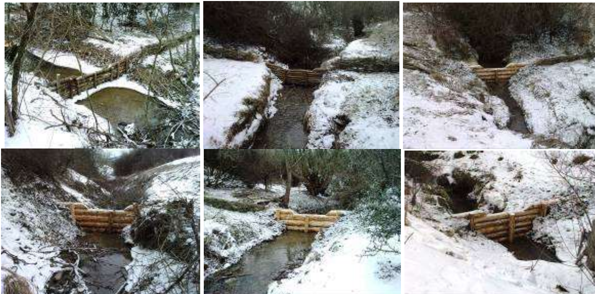
Pletené koše v poľnohospodárskej krajine (Stará Bystrica).